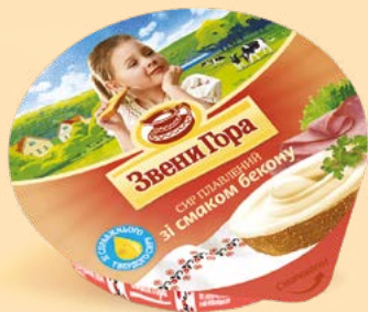
Зі смаком бекону