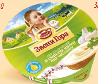
Зі смаком кропу та часнику