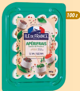
"АПЕРІФРЕ" Смаки провансу