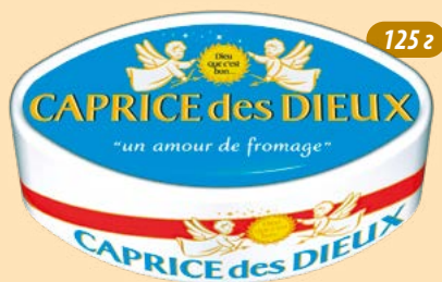
"Капріс Де Діо"