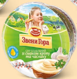
Зі смаком кропу та часнику