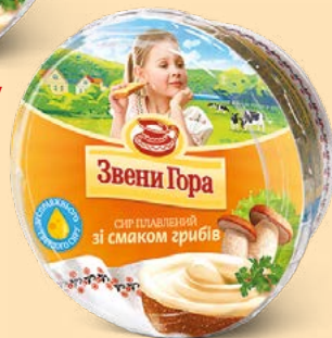
Зі смаком грибів