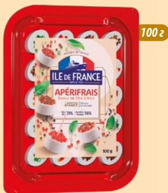
"АПЕРІФРЕ" Смаки лазурового берега