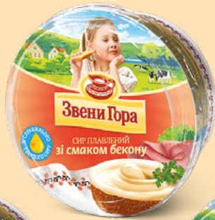
Зі смаком бекону