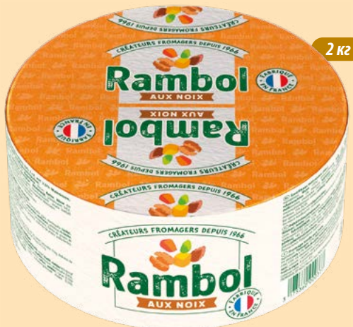
"Рамболь з горіхами"