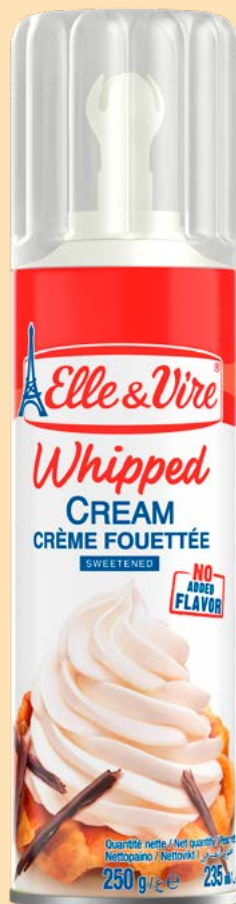
ВЕРШКИ ЗБИТИ СОЛОДКІ 27%