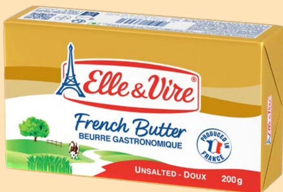
МАСЛО ВЕРШКОВЕ несолоне, 82%

Масло для справжніх гурманів. Зроблене з найкращого молока із Нормандії.