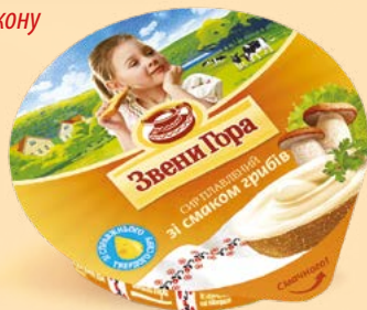
Зі смаком грибів