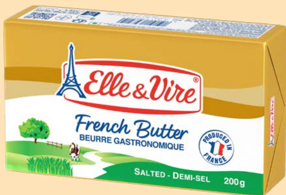
МАСЛО ВЕРШКОВЕ солоне, 80%