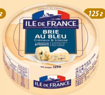
Брі з синьою пліснявою