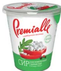
Зернистий 7% , гофрокартон – 12 шт.