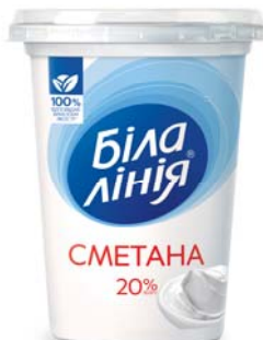
Сметана 20%, моностакан 350 г, півкороб – 8 шт.