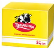
Суміш рослинно-молочна 62,5%, короб – 10/5 кг.