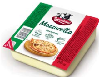
Моцаретта 45%, брикет 200 г, гофроящик – 24 шт.