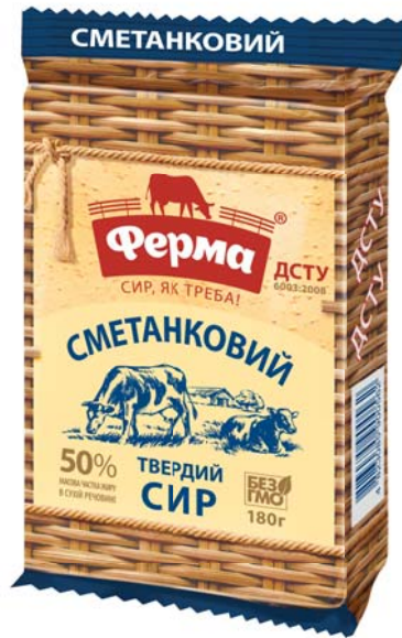
Сир Сметанковий 50%, брикет 180 г, шоу-бокс 17 шт.