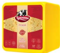
Руський класичний 50%, півбрус 6x2,5 кг