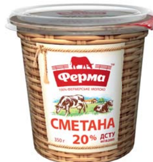
Сметана 15% та 20% стакан 350 г, стакан – 12 шт.