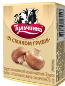
Зі смаком грибів 55%