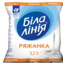
Ряжанка 3,2%, плівка 400 г, гофрокороб – 20 шт.