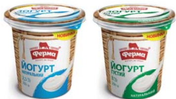
Йогурт густий 8% та йогурт натуральний 2,5%, стакан 250 г, гофрокороб – 10 шт.