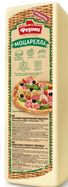
Моцарелла 45%, брус 2000 г