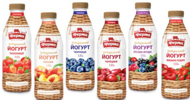
Йогурт полуниця, черешня, чорниця, персик, лісова ягода, вишня-годжі 1,5%, ПЕТ 820 г, термозбігова плівка – 6 шт.