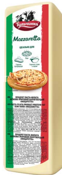
Моцаретта 45%, брус 2000 г, гофроящик – 6 шт.