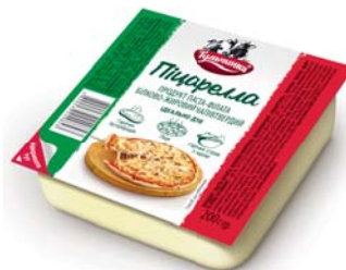
Піцарелла 45%, брикет 200 г, гофроящик – 24 шт.