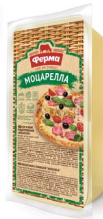
Моцарелла 45%, брус 1000 г

СИР М'ЯКИЙ ЧЕДДЕРИЗОВАНИЙ, брус 1000/2000 г, гофроящик – 9/6 шт.