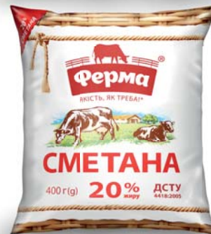
Сметана 15% та 20% , плівка 400 г, гофрокороб – 20 шт.