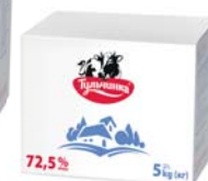
Паста рослинно - молочна 72,5%, короб – 10/5 кг.

Термін зберігання: за t° -25/ -18-11/-10 -5/-5-0/0+4 °C не більше 24/12/9/3 міс /60 діб.