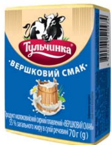
Вершковий смак 50%