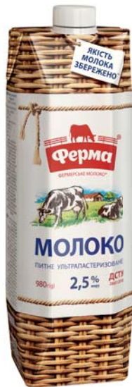
2,5%, TetraPrisma 980 г, гофрокороб – 8 шт.