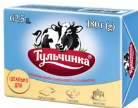
Тульчинська ніжна №2 62,5%