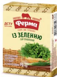
Із зеленню 55%