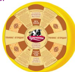
Пряжене молоко 50%, циліндр низький 2x8 кг