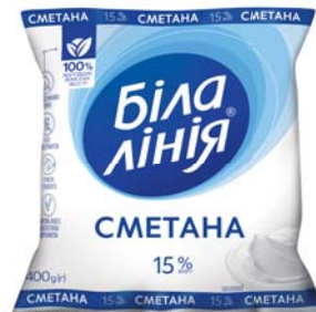
Сметана 15%, плівка 400 г, гофрокороб – 20 шт.