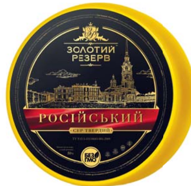
Сир Російський 50%, циліндр 2x8 кг, гофроящик – 2 шт.

Термін зберігання: круг, брус за t° від -4 до 0/0 до 8 °С не більше 180/150 діб, інші за t° від 0 до 6 °С не більше 120 діб.