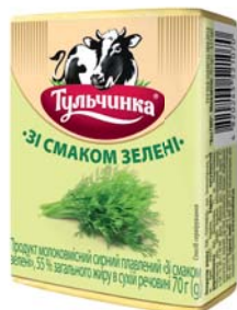
Зі смаком зелені 55%