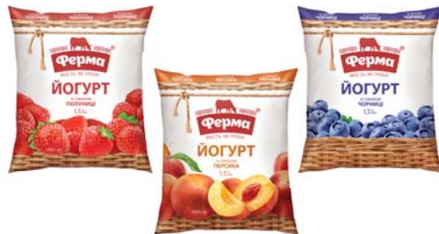
Йогурт полуниця, персик, чорниця 1,5%, плівка 400 г, гофрокороб – 20 шт.