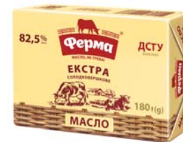
Екстра 82,5%, брикет в еколіні 180 г, гофроящик - 20 шт.

Термін зберігання: за t° -18/-12/-11 -6/-5-0 °C не більше 75/60/35 діб.