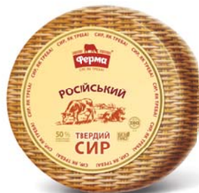
Сир Російський 50% , циліндр малий 2х4 кг, гофроящик – 2 шт.