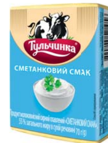
Сметанковий смак 55%

Термін зберігання: продукт сирний за t° від 0 до 4°C не більше 75 діб.