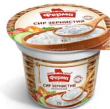
Сир зернистий 7%, Термін придатності: за t° від 2+6°C 14 діб.