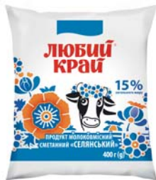
Сметанный продукт 15%/20%, плівка 400 г