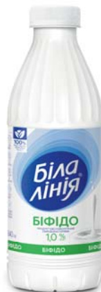
Біфідо 1% та 2,5%, ПЕТ 840 г, термозбігова плівка – 6 шт.