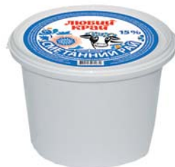
Сметанный продукт 15%/20%, відро 900 г