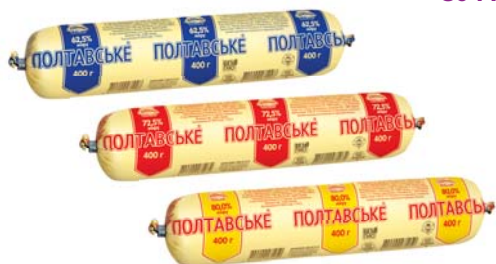
Особлива 62,5% / Традиційна 72,5% / Преміум 80%, туба у плівці 400 г, гофроящик – 10 шт.