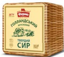
Сир Голландський 45% , півбрус 6х2,5 кг, гофроящик – 6 шт.