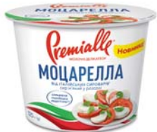
Моцарелла 45% , стакан 300 г, гофролоток – 6 шт.