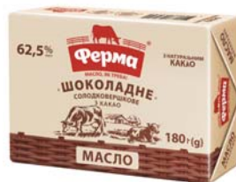
Шоколадне з какао 62,5%, брикет в еколіні 180 г, гофроящик - 20 шт.