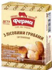
З лісовими грибами 55%