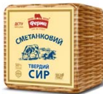
Сир Сметанковий 50% , півбрус 6х2,5 кг, ДСТУ, гофроящик – 6 шт.