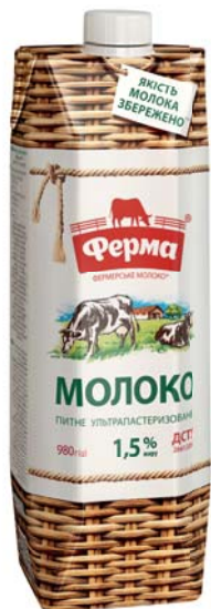
1,5%, TetraPrisma 980 г, гофрокороб – 8 шт.