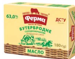
Бутербродне 63%, брикет в еколіні 180 г, гофроящик - 20 шт.