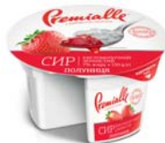
Полуниця, гофролоток – 8 шт.