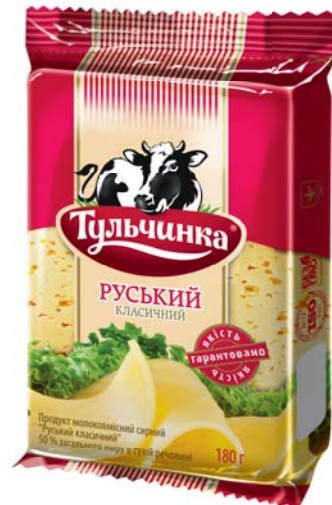
Руський класичний 50%, брикет 180 г, гофроящик - 17 шт.