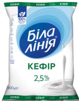
Кефір 2,5%, плівка 400/900 г, гофрокороб – 20/10 шт.