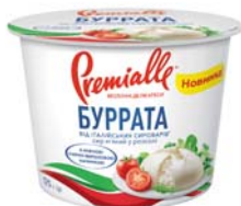
Буррата 55% , стакан 300 г, гофролоток – 6 шт.