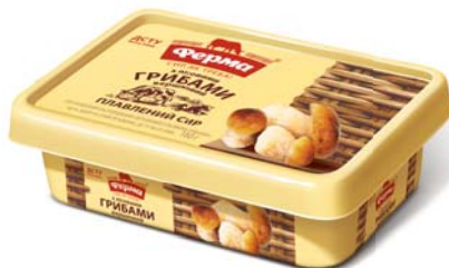
Вершковий з лісовими грибами 60%