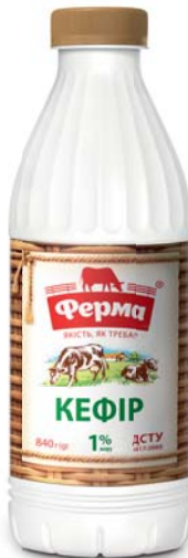
Кефір 1% та 2,5% ПЕТ 840 г, термозбігова плівка – 6 шт.