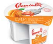
Абрикос-мед, гофролоток – 8 шт.