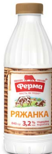
Ряжанка 3,2%, ПЕТ 840 г, термозбігова плівка – 6 шт.