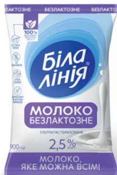
Молоко ультрапастеризоване безлактозне 2,5%, TF 900 г, гофроящик - 12 шт.