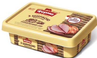
Вершковий з шинкою 60%

Термін зберігання: за t° 0+4 °С не більше 60 діб.