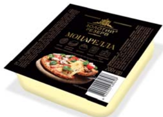
Моцарелла 45%, брикет 200 г, гофроящик – 24 шт.