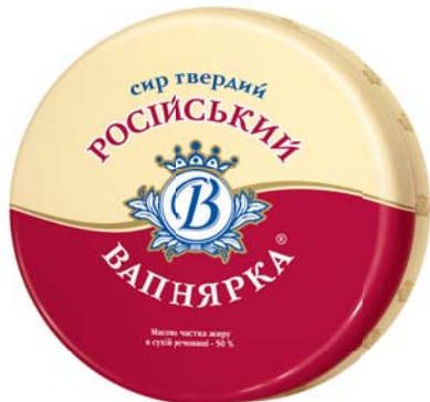
Сир Російський 50%, круг 2x8 кг