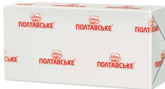
Традиційна 72,5%, брикет 1 кг, моноліт в картонному коробі – 8 шт.

Термін зберігання: за t° -18-11 /-10-5/-5-0/0+4 °С не більше 180/90/60/45 діб.