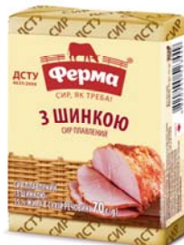
З шинкою 55%