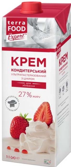
КРЕМ КОНДИТЕРСЬКИЙ 27% ТВА 1000 г, гофрлоток – 12 шт.

Термін зберігання: за t° +2 °C до +20°C 360 діб