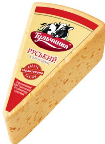
Руський класичний 50%, сегмент 170/190/210 г, шоу-бокс 18 шт.