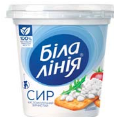
Сир зернистий 7% , палета – 6 шт.