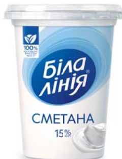
Сметана 15%, моностакан 350 г, півкороб – 8 шт.