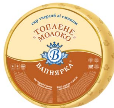
Сир твердий ТОПЛЕНЕ МОЛОКО 50%, круг 2x8 кг