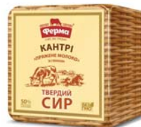
Сир «Кантрі» зі смаком пряженого молока 50% , півбрус 6х2,5 кг, гофроящик – 6 шт.