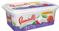
Фета безлактозна 45% , короб 230 г, гофрокартон – 8 шт.