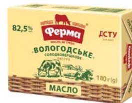
Вологодське 82,5%, брикет в еколіні 180 г, гофроящик - 20 шт.