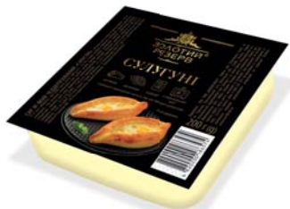
СУЛУГУНІ 45%, брикет 200 г, гофроящик – 24 шт.