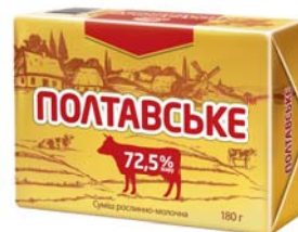
62,5% / 72,5%, брикет у фользі 180 г, гофроящик – 20 шт.