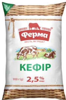
Кефір 2,5% плівка 900 г, гофрокороб – 10 шт.