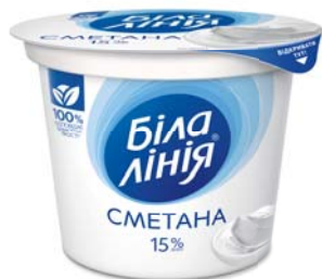
Сметана 15%, моностакан 200 г, півкороб – 8 шт.