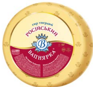
Сир Російський 50%, малий циліндр 2x4 кг