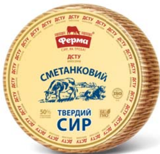
Сир Сметанковий 50% , циліндр 2х8 кг, ДСТУ, гофроящик – 2 шт.