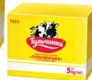
Суміш рослинно-вершкова Тульчинська 72,5%, короб – 10/5 кг.