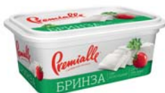
Бринза 35% , короб 230 г, гофрокартон – 8 шт.