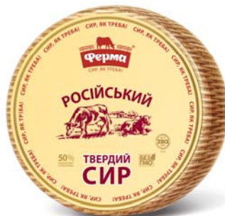
Сир Російський 50% , циліндр 2х8 кг, гофроящик – 2 шт.