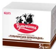
Суміш рослинно-вершкова шоколадна 62%, короб – 5 кг.