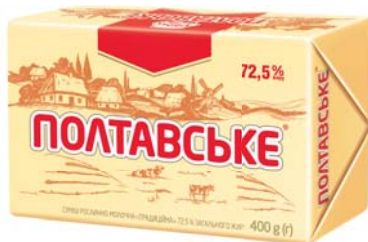
Традиційна несолена 72,5%, брикет в еколіні 400 г, гофроящик – 20 шт.