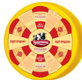
Руський класичний 50%, круг 2x8 кг

Термін зберігання: за t° 0 +6°C не більше 120 діб.