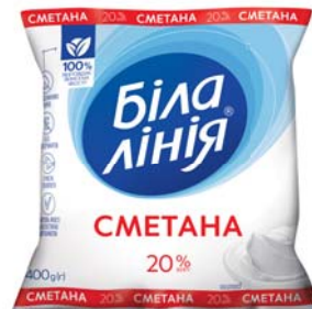
Сметана 20%, плівка 400 г, гофрокороб – 20 шт.

Термін зберігання: в моностакані за t^{\circ} 2 \pm 6^{\circ}C 21 доба, в плівці за t^{\circ} 4 \pm 2^{\circ}C 14 діб.