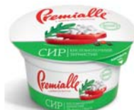
Кисломолочний, гофролоток – 8 шт.