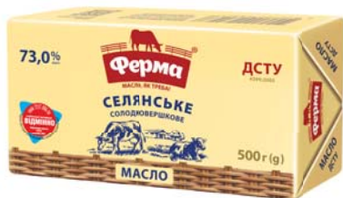
Селянське 73%, брикет в еколіні 100 г / 180 г / 500 г, гофроящик - 30 / 20 / 20 шт.