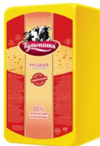
Руський класичний 50%, брус 3x5 кг