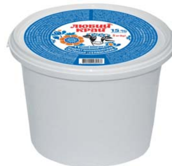
Сметанный продукт 15%/20%, відро 5 кг

Термін зберігання: за t^{\circ} 4 \pm 2^{\circ}C 21 доба.