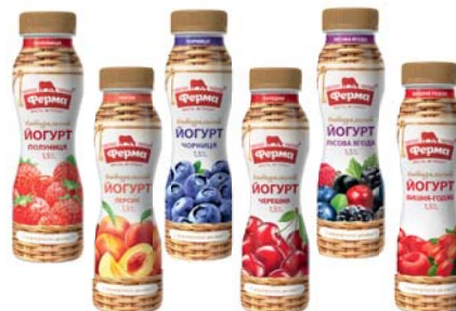
Йогурт полуниця, черешня, чорниця, персик, лісова ягода, вишня-годжі 1,5%, ПЕТ 250 г, термозбігова плівка – 8 шт.

Термін зберігання: Йогурт в стакані та плівці за t^{\circ} 2\pm 6^{\circ}\text{C} 21 доба. Йогурт в ПЕТ за t^{\circ} 2\pm 6^{\circ}\text{C} 24 доби.