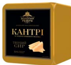
Сир «Кантрі» зі смаком пряженого молока 50%, півбрус 6x2,5 кг, пакет – 6 шт.