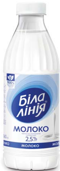
Молоко пастеризоване 2,5%, ПЕТ 840 г, термоплівка - 6 шт.