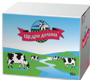
72,5% , моноліт у картонному коробі 10 та 5 кг.