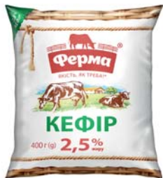
Кефір 2,5 % плівка 400 г, гофрокороб – 20 шт.