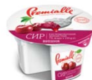
Вишня, гофролоток – 8 шт.