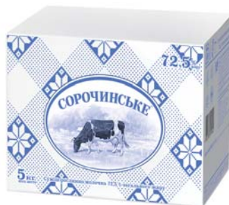
72,5% , гофрокартон – 5 кг.