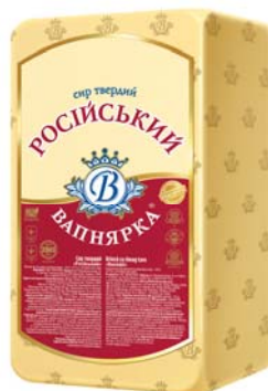
Сир Російський 50%, брус 3x5 кг