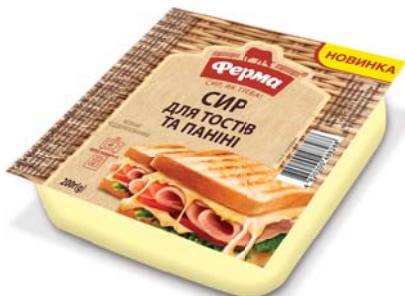
Для тостів та паніні 45%

СИР М'ЯКИЙ ЧЕДДЕРИЗОВАНИЙ, брус 1000/2000 г, гофроящик – 9/6 шт.