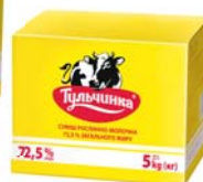
Суміш рослинно-молочна 72,5%, короб – 10/5 кг.