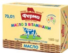
Селянське з вітамінами 73%, брикет в еколіні 180 г, гофроящик - 20 шт.