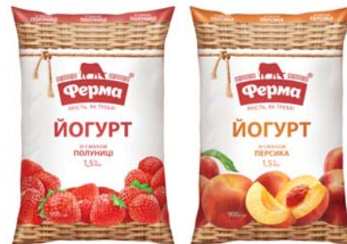
Йогурт полуниця, персик 1,5%, плівка 900 г, гофрокороб – 10 шт.