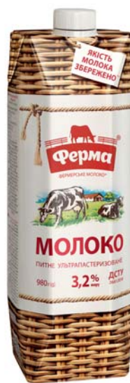
3,2%, TetraPrisma 980 г, гофрокороб – 8 шт.