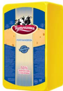
Голландець 50%, брус 3x5 кг