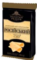
Сир Російський 50%, брикет 180 г, пакет – 17 шт.