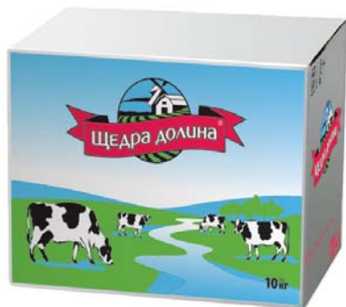
Несолона «Слов'янська» 62,5% , моноліт у картонному коробі 10 кг.