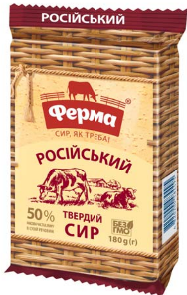
Сир Російський 50%, брикет 180 г, шоу-бокс 17 шт.