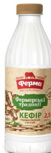
Кефір термостатний Фермерські традиції 2,5%, ПЕТ 900 г, термозбігова плівка – 6 шт.