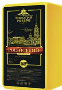
Сир Російський 50%, брус 3x5 кг, гофроящик – 3 шт.