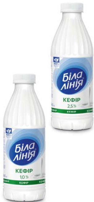
Кефір 1% та 2,5%, ПЕТ 840 г, термоплівка – 6 шт.