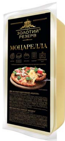
Моцарелла 45%, брус 1000 г, гофроящик – 9 шт.