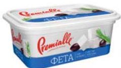
Фета 45% , короб 230/500 г, гофрокартон – 8 шт.