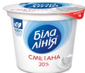
Сметана 20%, моностакан 200 г, півкороб – 8 шт.