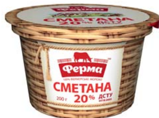
Сметана 15% та 20% стакан 200 г, стакан – 8 шт.