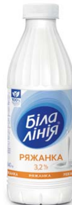
Ряжанка 3,2%, ПЕТ 840 г, термозбігова плівка – 6 шт.