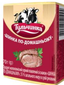
Шинка по-домашньому 55%