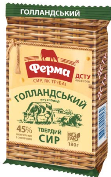
Сир Голландський брусковий 45%, брикет 180 г, шоу-бокс 17 шт.