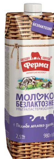
Безлактозне 2,5%, TetraPrisma 980 г, гофрокороб – 8 шт.

Термін зберігання: за t° від 1 до 25°C 180 діб за відсутності сонячного світла та у герметично закритій упаковці.