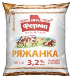
Ряжанка 3,2 % плівка 400 г, гофрокороб – 20 шт.