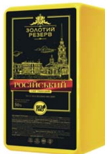
Сир Російський 50%, брус 3x5 кг, гофроящик – 3 шт.