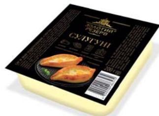
СУЛУГУНІ 45%, брикет 200 г., гофроящик - 24 шт.