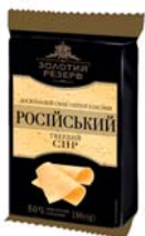
Сир Російський 50%, брикет 180 г, пакет – 17 шт.