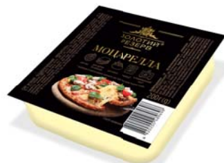
Моцарелла 45%, брикет 200 г, гофроящик - 24 шт.