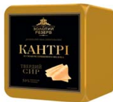
Сир «Кантрі» зі смаком пряженого молока 50%, півбрус 6x2,5 кг, пакет – 6 шт.