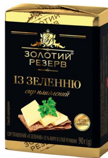
Із зеленню 55%

Термін зберігання: сир плавлений за t° 0+4°C не більше 75 діб, сир плавлений наливний не більше 60 діб.