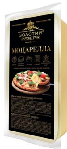
Моцарелла 45%, брус 1000 г, гофроящик - 9 шт.

Термін зберігання: сир м'який за t° від 0°C до +6°C не більше 50 діб, паста-філата не більше 45 діб.