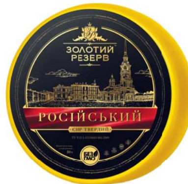
Сир Російський 50%, циліндр 2x8 кг, гофроящик – 2 шт.

Термін зберігання: круг, брус за t° від -4 до 0/0 до 8 °С не більше 180/150 діб, інші за t° від 0 до 6 °С не більше 120 діб.